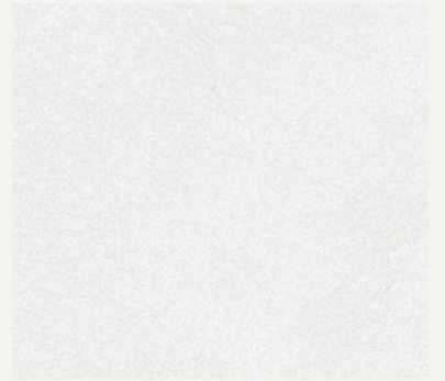
DUNE OPACO BASE SILVER