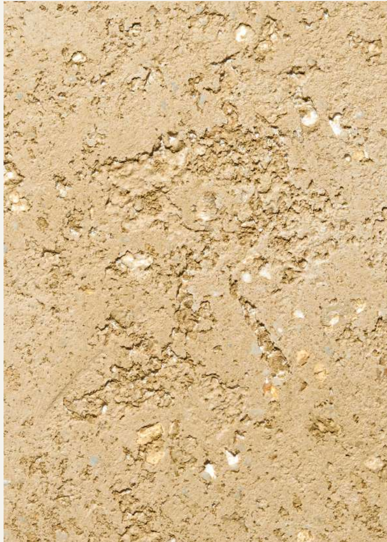
ARCHI+ PIETRA INTONACO BIANCO & PATINA MINERALE NEUTRA & PATINA MINERALE 6202