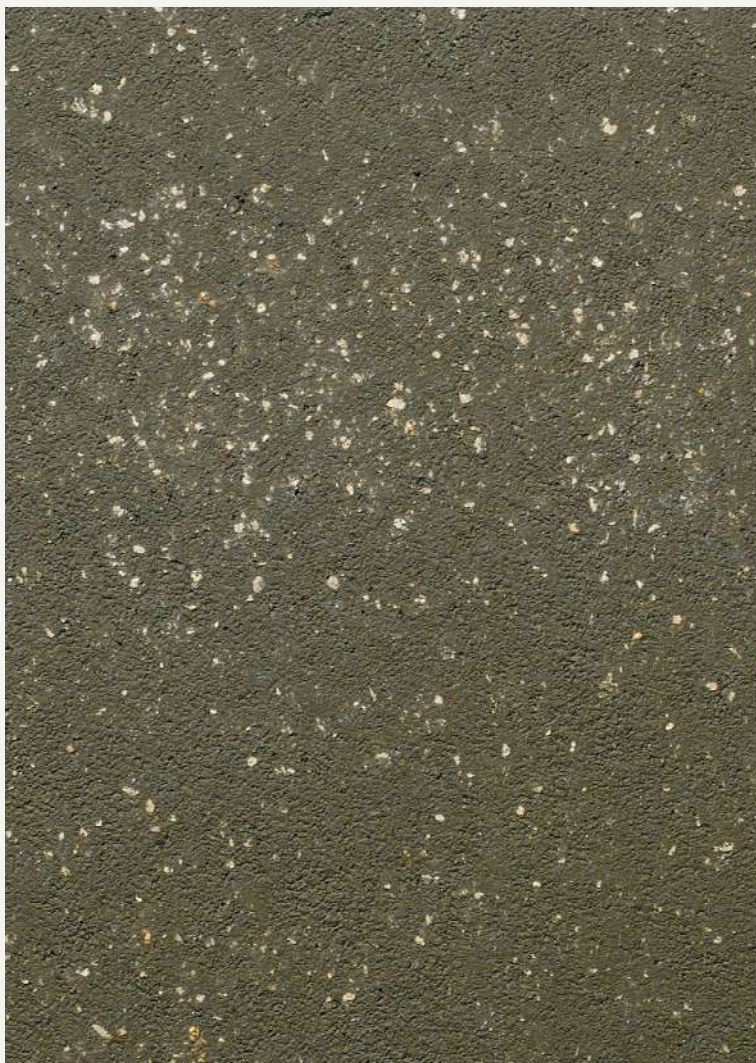
ARCHI+ PIETRA 19036 & CERA WAX PLUS