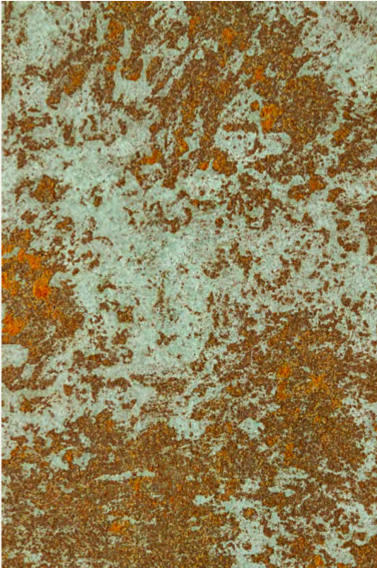
VERDERAME_Wall Painting & IRONic

The ancient structures of old cities with the beauty of copper and its vibrant oxidation.