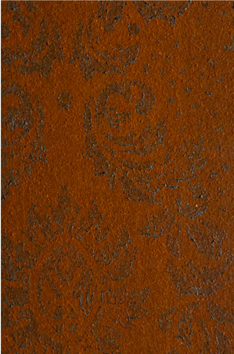
IRONic & Africa Asmara A314

A combination of metal and rust. The oxidation is produced with the application by stencil of Africa on the IRONic wall.