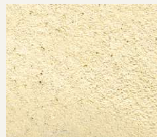
ARCHI+ TADELAKT 010