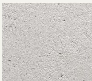
ARCHI+ TADELAKT 007