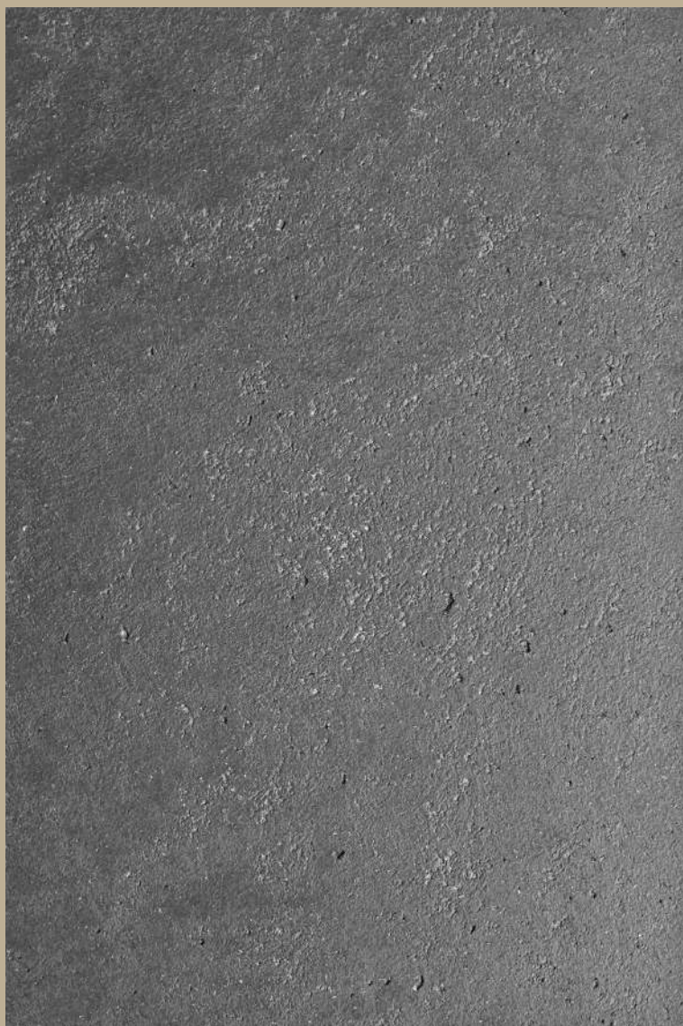
ARCHI+ TADELAKT 001

“ Superfici lisce e sinuose simili al marmo con una componente naturale e materica che dona un estremo piacere al tatto. ”