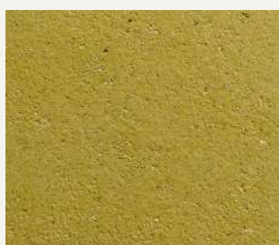
ARCHI+ TADELAKT 003