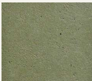
ARCHI+ TADELAKT 004

Le tonalità qui riprodotte, pur avvicinandosi a quelle di fornitura, sono indicative. Per una corretta lettura dei colori si raccomanda di consultare questa cartella alla luce solare. Colours and patterns illustrated are for guidance only. The exact pattern, colours and shades may vary from those shown.