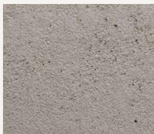
ARCHI+ TADELAKT 006