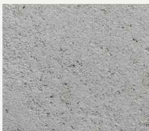
ARCHI+ TADELAKT 008