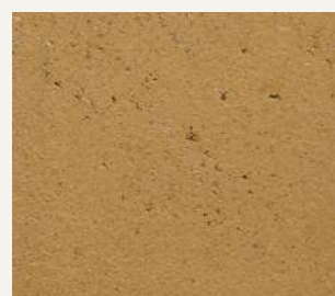
ARCHI+ TADELAKT 011