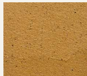
ARCHI+ TADELAKT 012