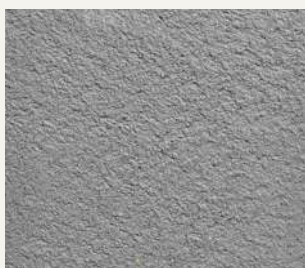
ARCHI+ TADELAKT 005