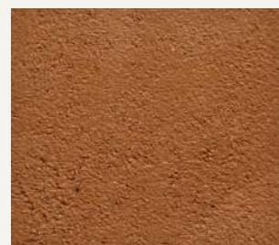
ARCHI+ TADELAKT 013

“ Smooth decorated walls that look like marble, with a natural and mineral visual, and a touch-feel appeal. ”