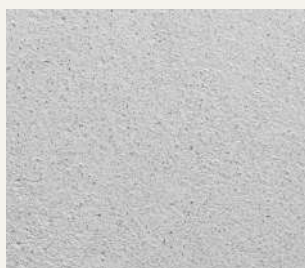
ARCHI+ TADELAKT 009